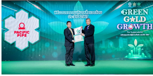
ธงขาวดาวเขียว